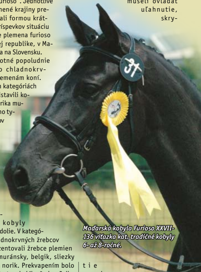
Maďarská kobyľa Furioso XXVII-136 víťazka kat. tradičné kobyly 6- až 8-ročné.

Oblasť Pusty bola bohatá na zbojníkov. Ich kone museli ovládať ulahnutie, skry-