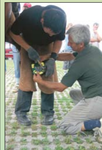
Súčasťou sprievodného programu bol aj workshop na tému Nové trendy v podkúvaní koní (aj s praktickou ukážkou firmy Easy Walker).

V nedeľu pripravili organizátori bohatý program začínajúci